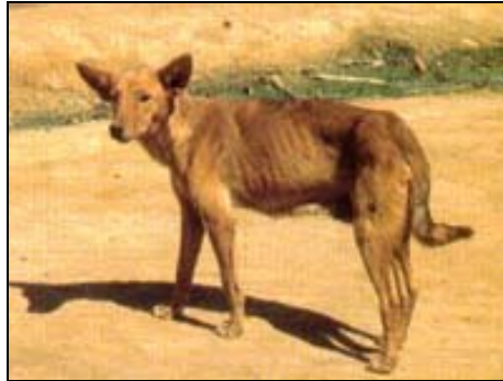
Abb. 2 : Alika Gasy im nördlichen Hochland (fwö)

im trockenen Süden und Südwesten von Madagaskar, leben Tiere von einem einheitlichen, fast dingoähnlichem Habitus. Dieser, vom Erscheinungsbild her dem Dingo ähnelnde Hundetyp, neigt am ehesten zum Verwildern und stellt aufgrund seines weiten Verbreitungsgebietes vermutlich eine eigene alte „Naturrasse“ dar, wobei er am ehesten den Typ des „Alika Gasy“ verkörpert. Sie ähneln (Abb. 2) somit auch einigen aus dem östlichen und südlichen Afrika stammenden Hundeformen, wie sie der Südafrikaner John GALLANT beschreibt (1996, 1998).