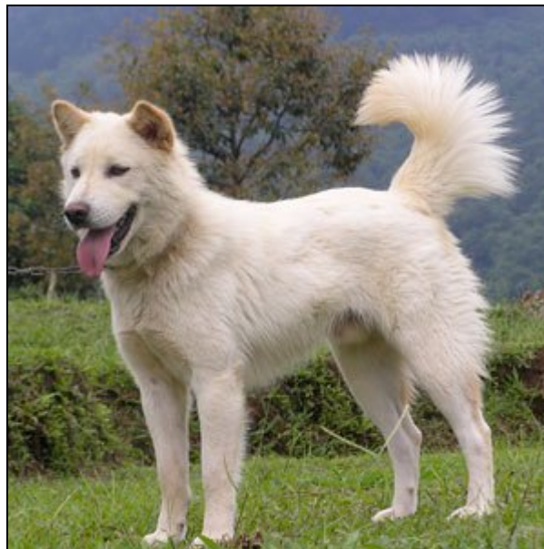
Abb. 5: Zuchtform des Kintamanihundes

In der kühlen Bergregion Nordost-Balis hat der mittelgroße und spitzzähnliche Kintamanihund (Abb. 5) ein dichtes, langes Fell mit dichter Unterwolle. (Kintamani ist eines von mehreren Dörfern am Kraterrand des Batus in 1.600 m Höhe). Der Tenggerhund hatte wohl Ähnlichkeit mit den chinesischen Spitzen - eigene Beobachtungen des Autors an balinesischen Kintamanihunden zeigten blaue Pigmentflecken an Zunge und Lefzeninnenseite. Diese Erscheinung wird ebenfalls von RÄBER (2001) berichtet, dass nämlich in China auf dem Lande lebende Parias, Stammformen des Chow chow, ebenfalls eine blaue Zunge und blaue Pigmente in der Mundhöhle haben; ebenso wie der Kintamanihund trugen sie ihre Ruten auf dem Rücken.