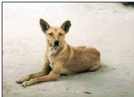
Abb. 1: Alika Gasy im nördlichen Hochland

Glücklicherweise trifft dies noch nicht für viele der Hunde in den entlegeneren Regionen Madagaskars zu, und, um STREBEL nochmals zu zitieren: „Wenn diese Hunde auch scheinbar mit den unsrigen nichts zu tun haben, so sind sie doch deshalb von großer Wichtigkeit für uns, weil sie den Hund in wildem und halbwildem Zustand zeigen. Wollen wir einen richtigen Einblick in die Entwicklungsgeschichte unseres Hundes gewinnen, so müssen wir uns der Vollständigkeit halber mit ihnen beschäftigen ... Es liegt hier ein unermessliches Feld für die Forschung vor uns ...“ . Auch der Österreicher Hellmuth WACHTEL (2002) sieht in den Schensis wertvolle kynologische und anthropozoologische Forschungsobjekte, die Aufschluss über das ursprüngliche Mensch-Hund-Verhältnis geben können und „... gleichermaßen als Natur- wie als menschliches Kulturgut zu werten sind.“ Leider wird dieses Feld immer noch zu wenig bearbeitet, und Schensi- und Pariahunde haben bis heute kaum eine Lobby: Der Zoologe beachtet sie nicht, da sie eben keine echten Wildtiere mehr sind; die Haustierforschung vernachlässigt sie ebenfalls, da der Mensch keinerlei Selektion auf bestimmte Merkmale hin betreibt (Abb. 1).