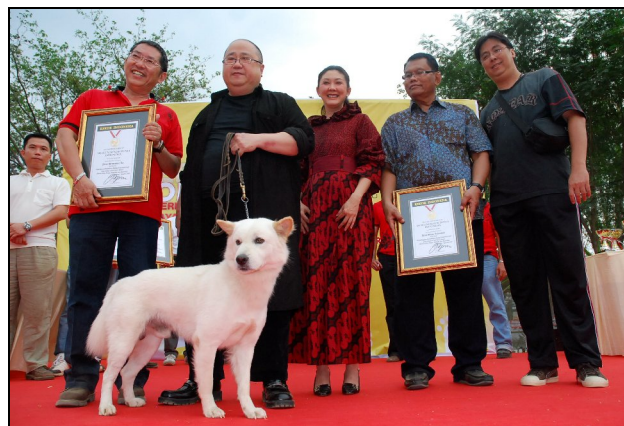
Abb. 7: Auf Betreiben von „Freunden“ des Kintamanihundes wird nun seit 2009 der Kintamanihund von der Internationalen Kynologischen Vereinigung (FCI) als Rassehund geführt und auch mit Profit exportiert

Vergleichbar mit dem ausgerotteten Bali-Tiger, dem selten gewordenen Bali-Star und der Wildform des Bali-Rindes (Banteng) ist der ursprüngliche Kintamanihund ein einzigartiges Tier und schützenswert; er wird aber nicht überleben, wenn er als Rassehund (Abb. 7) in Mode kommt und nach dem jeweiligen Zeitgeschmack züchterisch umgeformt werden wird.