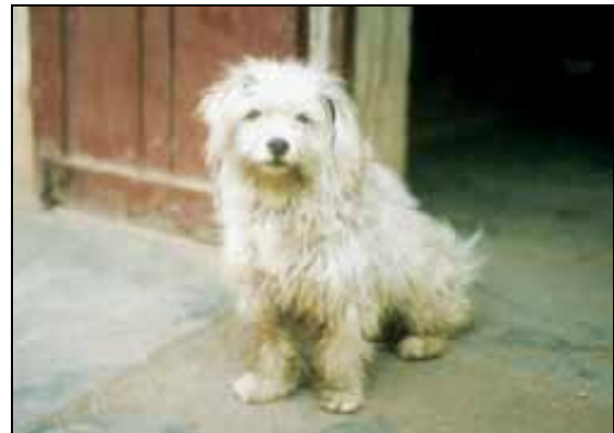
Abb. 3a: Coton de Tuléar (links nach FCI-Standard) in Europa